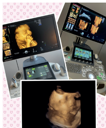
Ecografia ostetrica e ginecologica 3D 4D Richiedi il referto su chiavetta USB